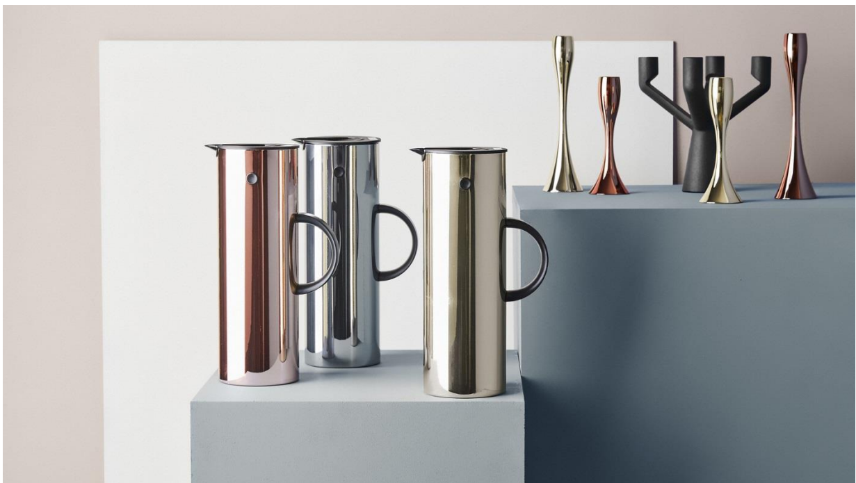
Fot. kuchyňské doplňky a dekorace Stelton