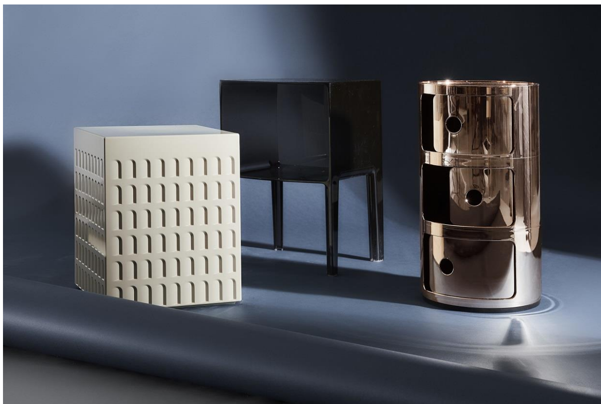
Fot. konferenční stoly Kartell

„Předchozí roky ukázaly, že mnozí naši klienti čekají na příležitost spojenou s Black Friday. V návaznosti na loňský rok jsme proto přidali speciální nabídky i v sobotu a neděli. Sobota bude kvintesencí stylu Westwing, tj. kampaně prezentující 4 nejpoblárnější kolekce Westwing: glam, art deco, loft a moderna. Neděle bude šancí pro koupi produktů, které jsou k dostání pouze na Westwing, mimo jiné čalouněného nábytku, nástěnných dekorací a příborů. Kromě toho ve stejný den začínají na stránce kampaně velkých značek jako jsou Braid, Kartell či Iker“ říká Delia Fischer, kreativní ředitelka Westwing.