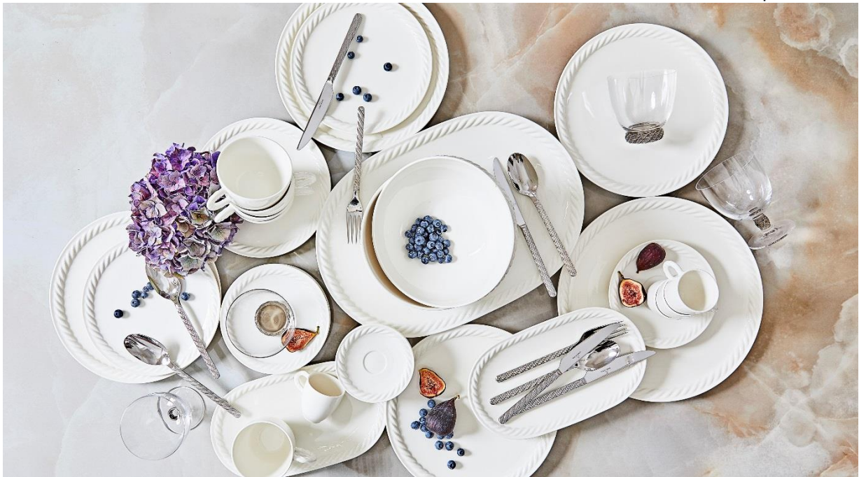
Fot. porcelán Villeroy & Boch