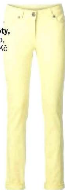
kalhoty, Takko, 599 Kč

Seznámení se zajímavým člověkem změní váš pohled na kariéru. Nebojte se udělat něco jinak! Devatenáctého zbystřete, nastane pro vás jeden z nejdůležitějších dnů tohoto roku. Můžete potkat toho pravého! Letní cíl: Alpy. Prahnete po adrenalinu. Co zkusit rafting na divoké řece?