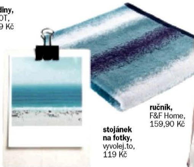
stojánek na fotky, vyvolej.to, 119 Kč