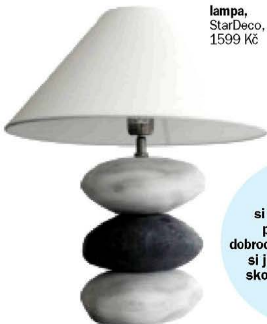
lampa, StarDeco, 1599 Kč