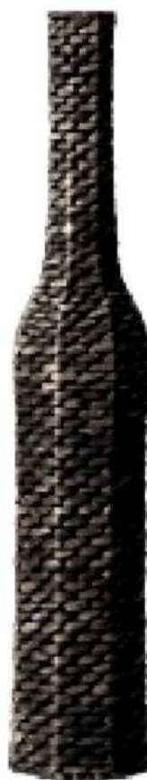
váza, IKEA, 799 Kč