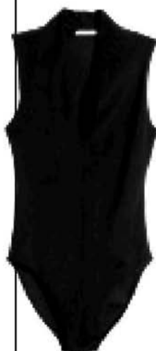
body, H & M, 799 Kč