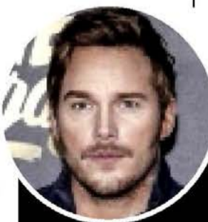
CHRIS PRATT 21. 6. 1979

Obzvláště šťastnou ruku budete mít osmnáctého. Pokud chcete pozvat sexy známého na víno, teď je ta chvíle! Do života vám možná vpadne bývalý. Za rohem už ale čeká někdo lepší! Cíl: Skandinávie. Lákají vás extrémní a na severu jich najdete spoustu.