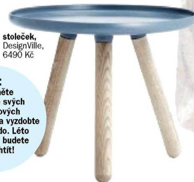
stoleček, DesignVille, 6490 Kč

TIP: Vytiskněte si fotky ze svých prázdninových dobrodružství a vyzdobte si jimi hnízdo. Léto skončí, kdy budete sama chtít!