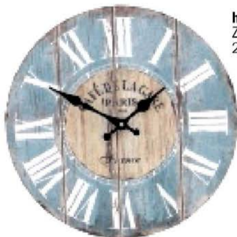
hodiny, ZOOT, 299 Kč

Nemusíte trávit celé léto u moře, abyste se cítila odpočatě. Stačí byt vyšperkovat těmihle doplňky!