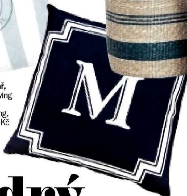
proutěný koš, Bella Rose, 1239 Kč