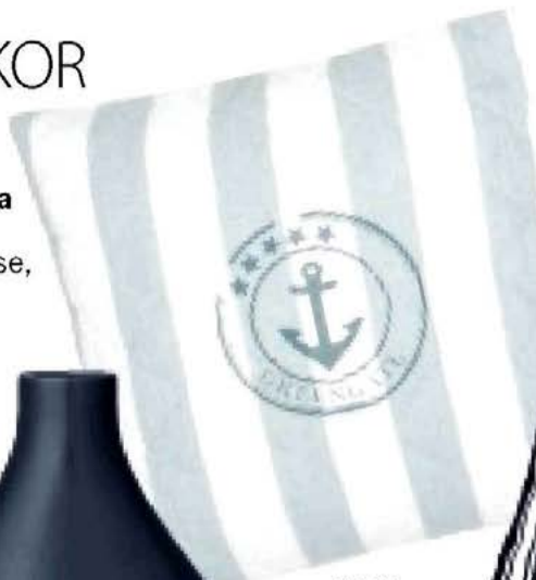
polštář, Westwing Home & Living, 1249 Kč