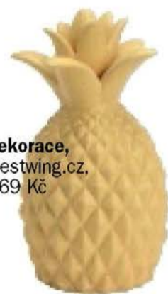
dekorace, westwing.cz, 469 Kč

Těkáte mezi spoustou projektů. Soustředte se na ten nejdůležitější. První týden v červenci budte ve střehu, abyste nepropásla úžasnou pracovní příležitost. Nového muže si zpočátku držte od těla. Možná k vám není úplně upřímný, ale nejpozději devatenáctého se projeví, jestli vám vůbec stojí za pozornost. Rozjed'te se: Do Barcelony. Potěší všechny smysly!