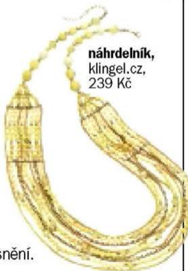
náhrdelník, Klingel.cz, 239 Kč

Středem vaší pozornosti by měli být muži, protože na scénu nakráčejí hned dva zajímaví nápadníci. Vyberte si toho citlivějšího a laskavějšího z nich. Cíl na míru: Thajsko. Najděte si romantickou pláž, natáhněte se na písek a oddejte se romantickému snění.