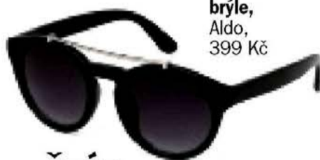
brýle, Aldo, 399 Kč

Budete mít lepší vyřídilku než obvykle, takže snadno pojmenujete svoje pocity. Využijte tohoto daru hlavně v lásce! Okolo devatenáctého už ale přeměřte svoji pozornost na nedodělané úkoly, protože teď konečně všechno dotáhnete do konce!