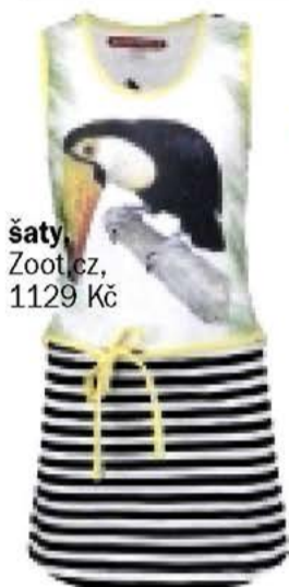
šaty Zoot.cz, 1129 Kč